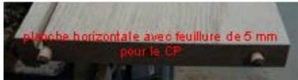
planche horizontale avec feuillure de 5 mm pour le CP