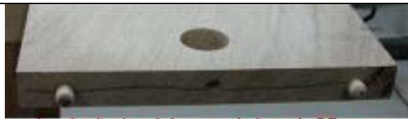
planche horizontale avec le trou de 25 pour l'excentrique